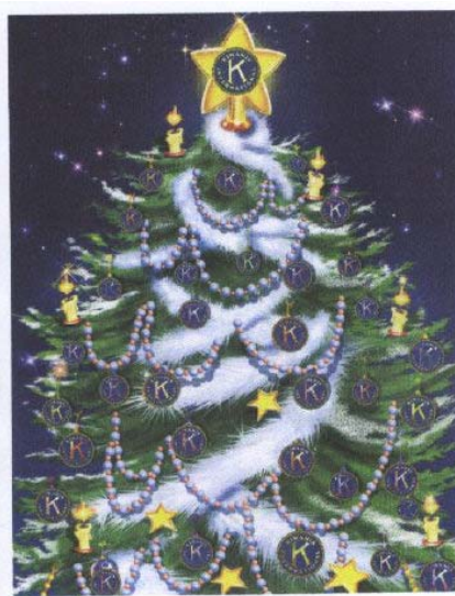
L'immagine augurale è tratta dal cartoncino d'invito al Concerto di Natale organizzato dal Kiwanis Club Biella Victimula Pagus.